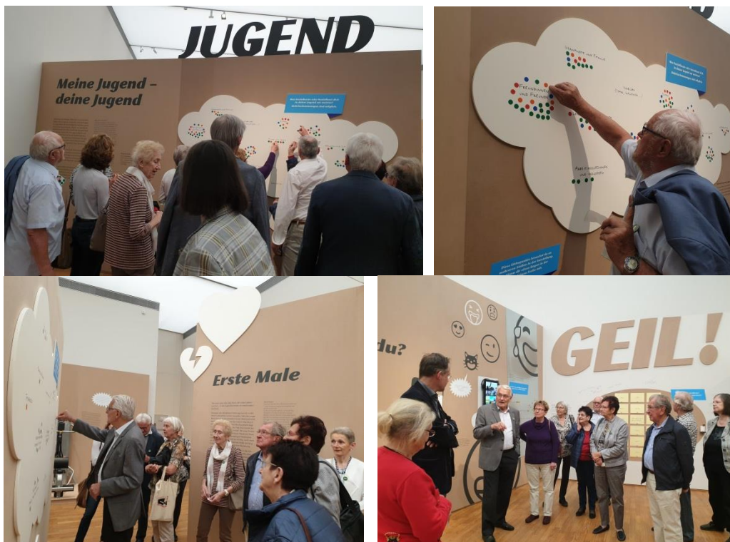
PREVIEW DER AUSSTELLUNG „MEINE JUGEND – DEINE JUGEND“, 24.4.2019, MUSEUM NIEDERÖSTERREICH