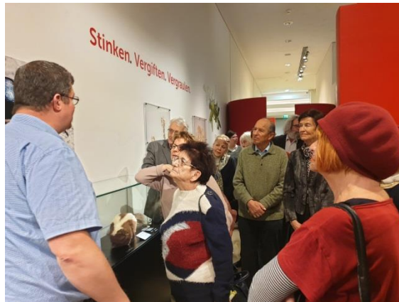
20.3.2019: PREVIEW IM MUSEUM NIEDERÖSTERREICH