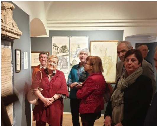
7.3.2019: SONDERFÜHRUNG IM STADTMUSEUM ST. PÖLTEN